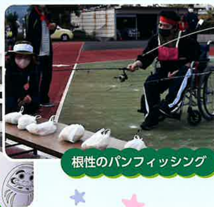
根性のパンフィッシング