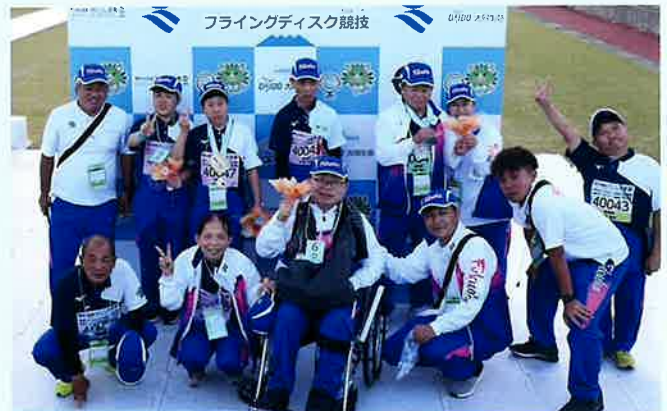
福岡県フライングディスク競技選手団一同と