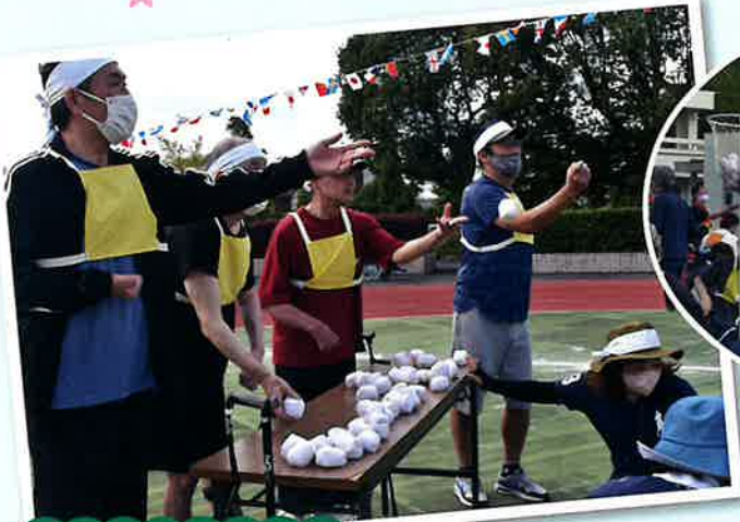
息を合わせて玉入れ競技