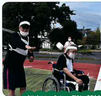
努力のダルマ倒し競技