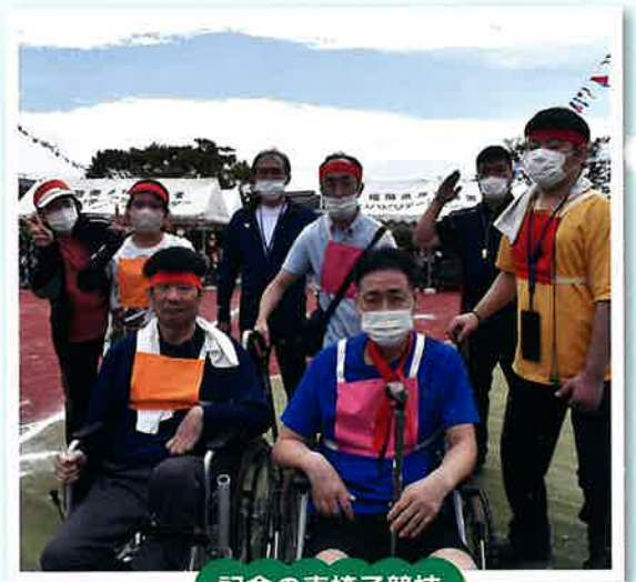
記念の車椅子競技