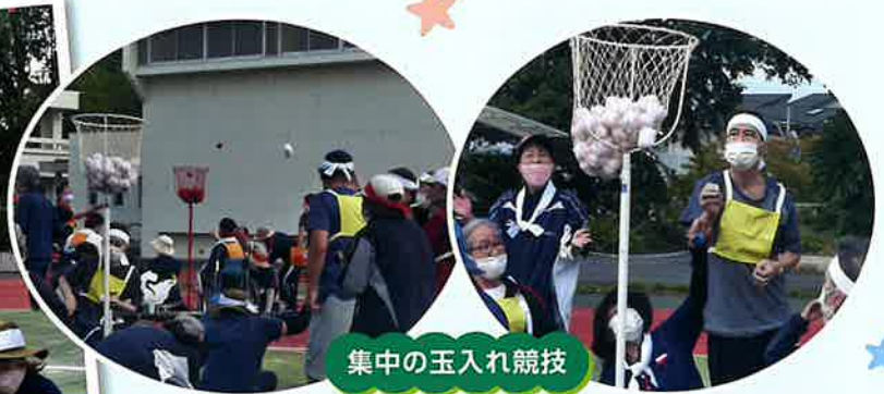
集中の玉入れ競技