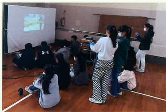
①センター紹介(動画)

いつも千鳥小の皆さんから「プルタブ・アルミ缶回収運動」により車イスを寄贈いただいています。