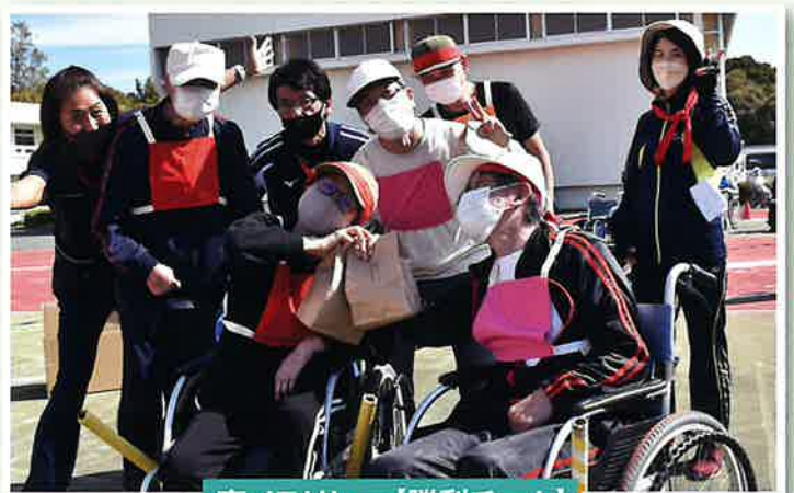
車イスリレー【勝利チーム】