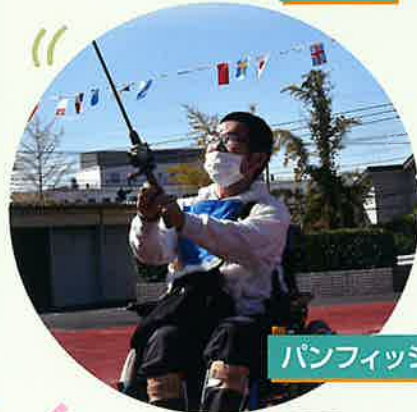
パンフィッシング