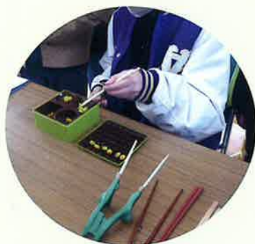
③片麻痺作業体験(箸)