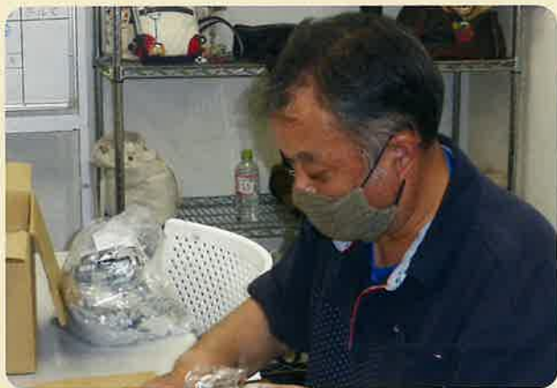
商品を箱詰めする軽作業をしています